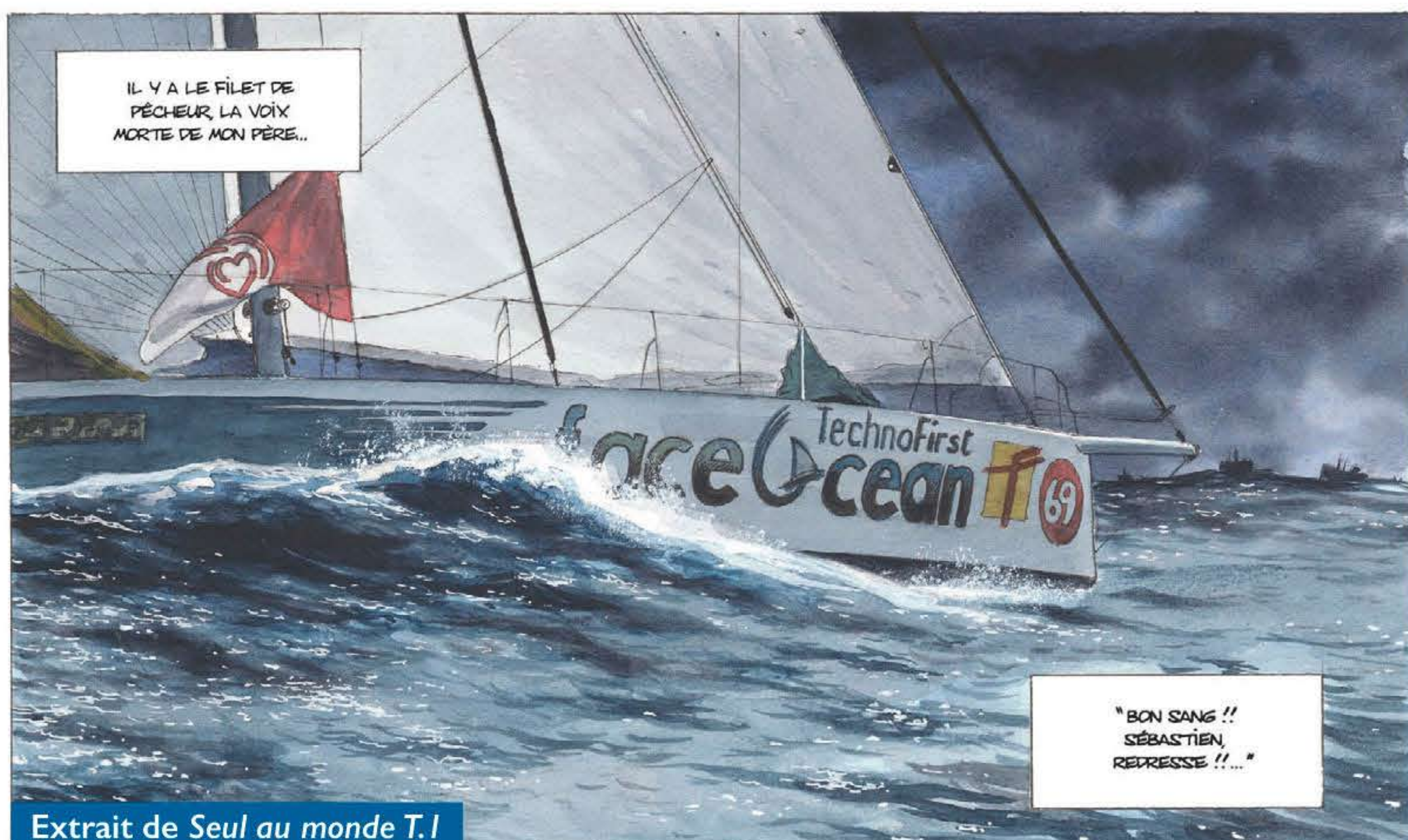
Extrait de Seul au monde T.1

En accord avec l'auteur, je propose vingt-cinq planches originales, soit